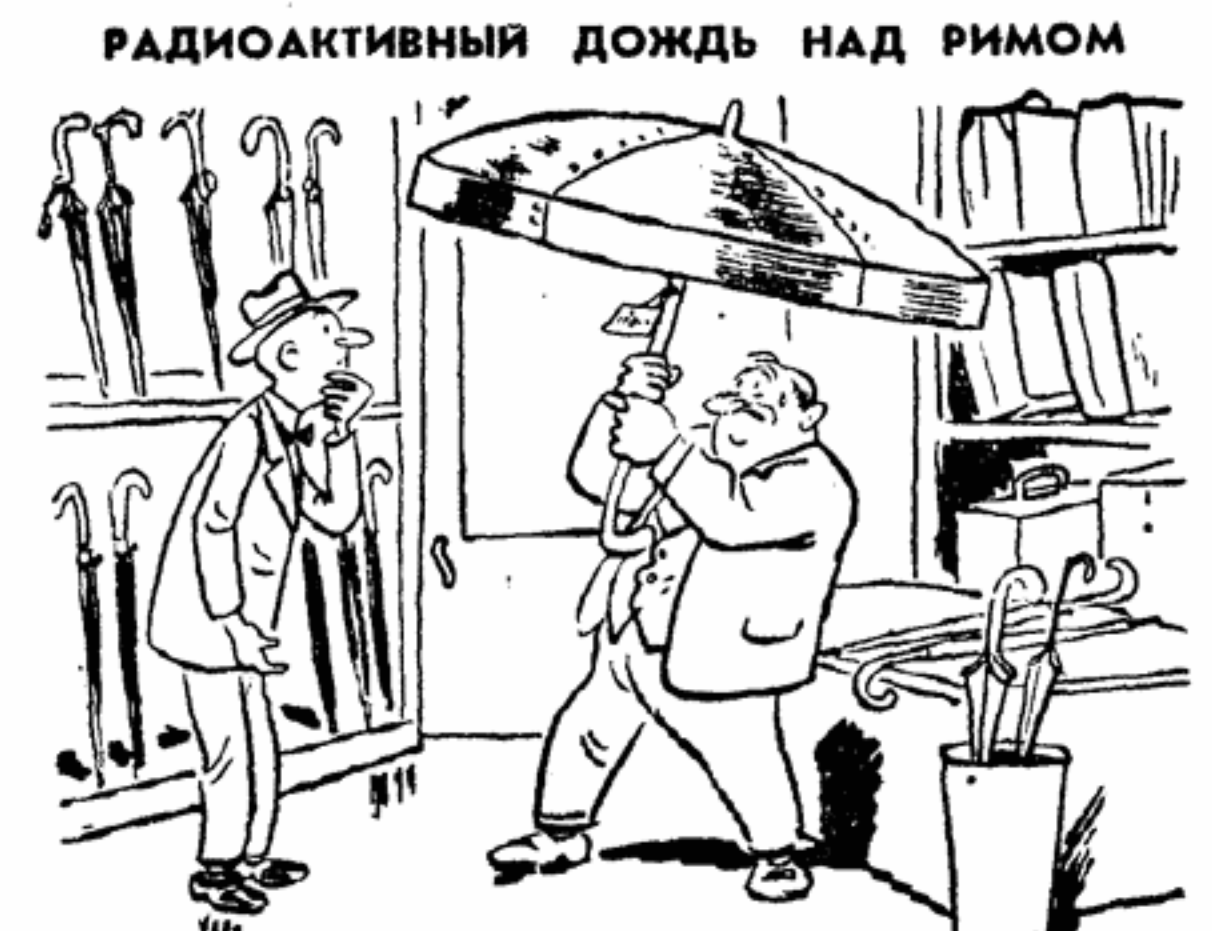
— Советую вам купить этот зонтик — лучшее средство от радиоактивных осадков! — А не считаете ли вы, что еще более эффективным средством было бы прекратить испытания атомных бомб?