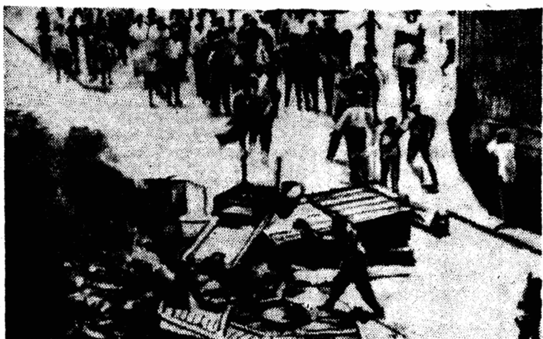
На снимке: демонстранты в Бейруте в знак протеста против американского вмешательства во внутренние дела Ливана...