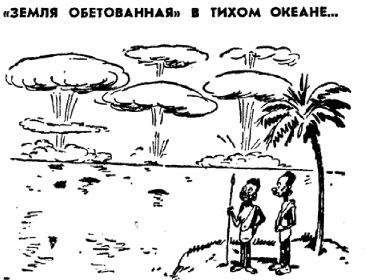
«ЗЕМЛЯ ОБЕТОВАННАЯ» В ТИХОМ ОКЕАНЕ... — Пришла весна! — Почему ты думаешь? — Потому что «грибы» растут у нас только в это время года.