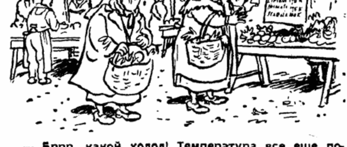
— Бррр, какой холод! Температура все еще понижается! — А вы пойдите погреться около преискусурнта: там вас сразу в жар бросит.

Не в раз рисунки Камерини воспроизводились и в «Литературной газете». Сегодня мы помещаем еще несколько его карикатур, опубликованных в последнее время газетой «Паззез».