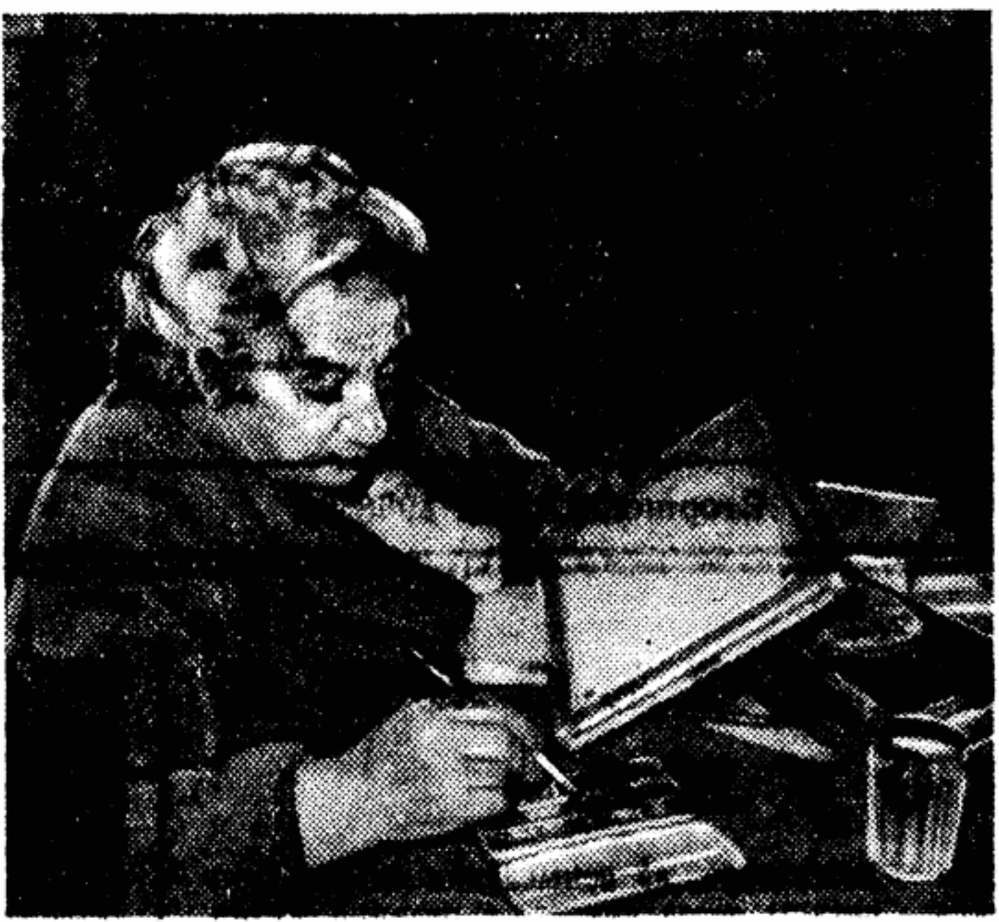
ЗА РАБОЧИМ СТОЛОМ ПИСАТЕЛЯ

Таким образом, в Москве (нан, очевидно, и в других городах) есть значительные резервы улучшения медицинского обслуживания населения. Надо только настоящие исшать эти резервы, быстрее привести их в действие.