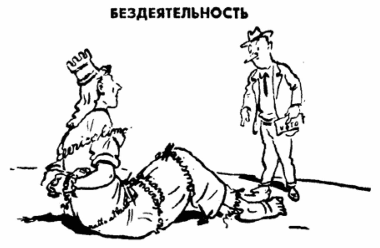
Итальянец с избирательным бюллетенем в руке: — Когда же ты наконец сдвинешься с места? Италия, оуланная цепями «клерикализма», «монопольи», «атлантического пакта», «христианской демократии», «мошеничества»...